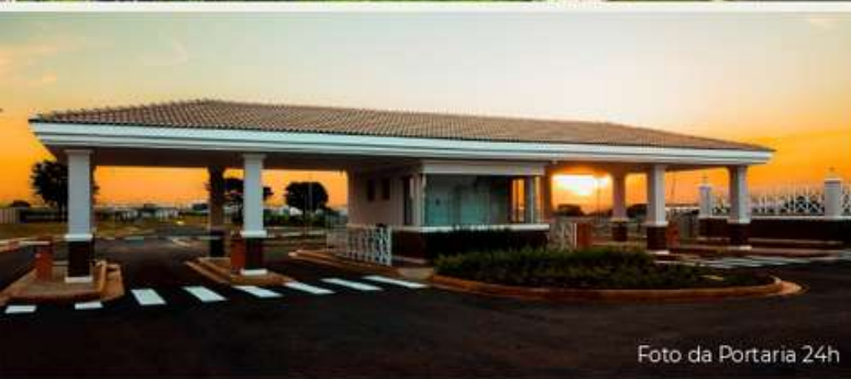
Foto da Portaria 24h