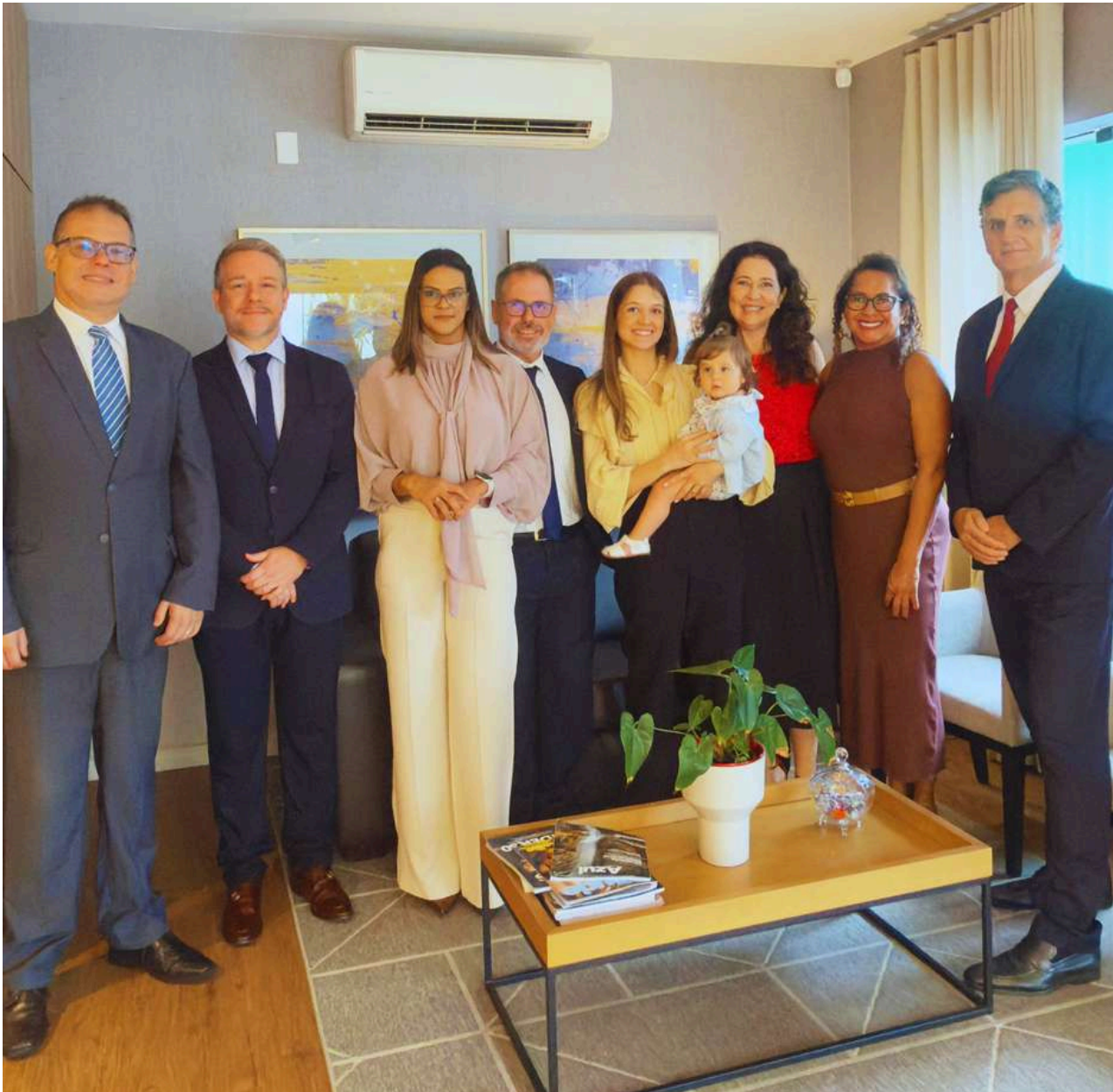
Tonsig Medeiros Schiavon Advocacia

Por meio do projeto “OAB Perto de Você”, a Diretoria da OAB Americana intensifica sua presença nos escritórios da Subseção, promovendo diálogo direto, escuta ativa e fortalecimento institucional da advocacia.