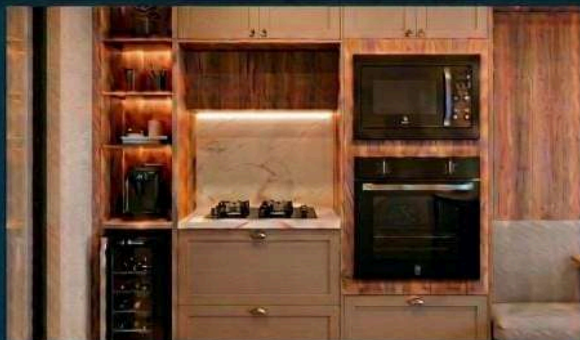
*Imagens ilustrativas. Consulte por demais informações.

GANHE O KIT PREMIUM EM PROJETOS A PARTIR DE R$ 50.000,00 (FORNO + COOKTOP + MICRO-ONDAS)