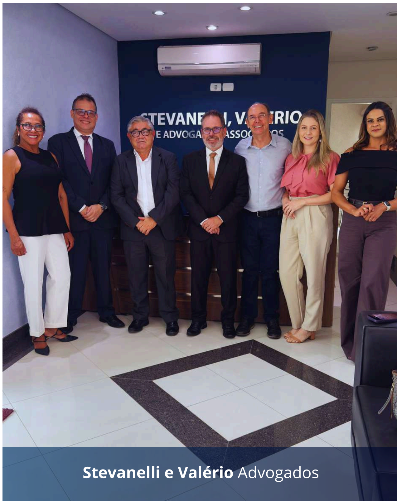
Stevanelli e Valério Advogados