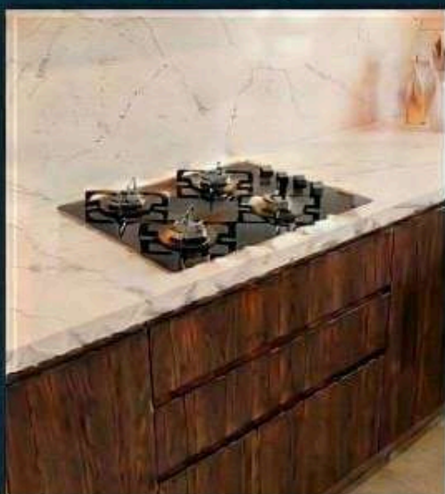
*Imagens ilustrativas, Cooktop 4 bocas.

GANHE UM COOKTOP EM PROJETOS A PARTIR DE R$ 20.000,00